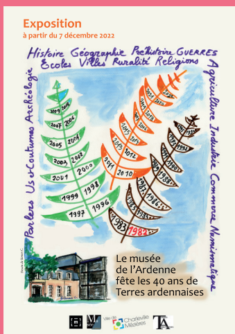
Au musée de l'Ardenne