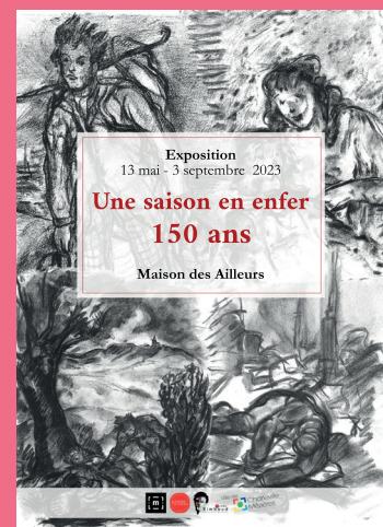
Maison des Ailleurs

Le musée Arthur Rimbaud sera fermé les 15 et 16 juin 2023 en raison de l'installation de la nouvelle présentation !